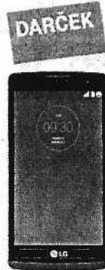
LG LEON 4G LTE